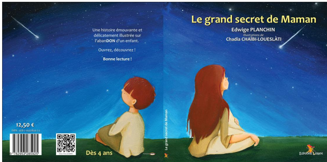
Couverture dépliée du livre